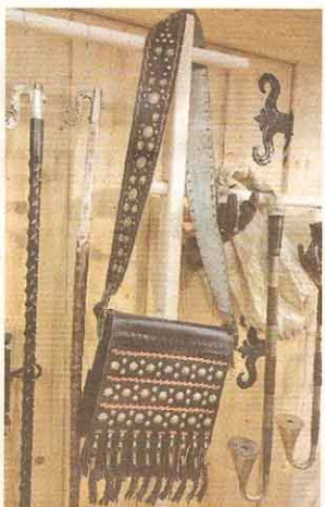
TAŠKA. Stačilo by tenčí ucho a hned by s touto brašnou člověk vyrazil do ulic, jak je krásná. Bačové ji nosili na pastviny. Prý o ni ale důkladně pečovali. Ozdobu na ní se musely vždy lesknout.