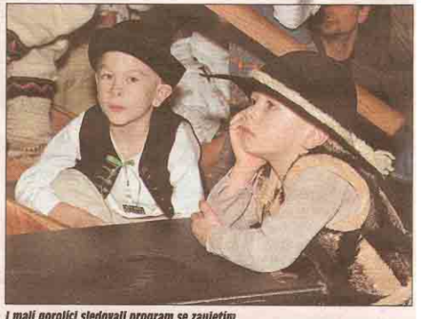
Z vystupujících členů souborů se stali i vědní diváci...