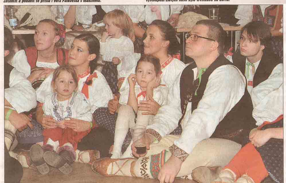
Program letošní přehlídky stál věru za zhlédnutí. A nejlepší místa ke koukání byla přímo na parketu!