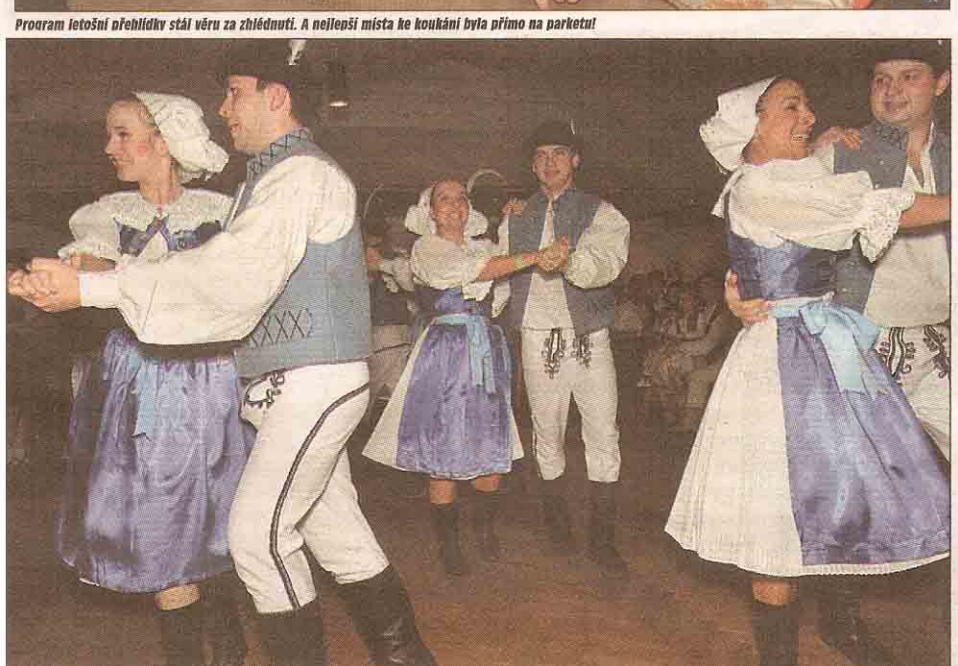
Krásné tance z Myjavy předvedl brněnský soubor Jánošíček.